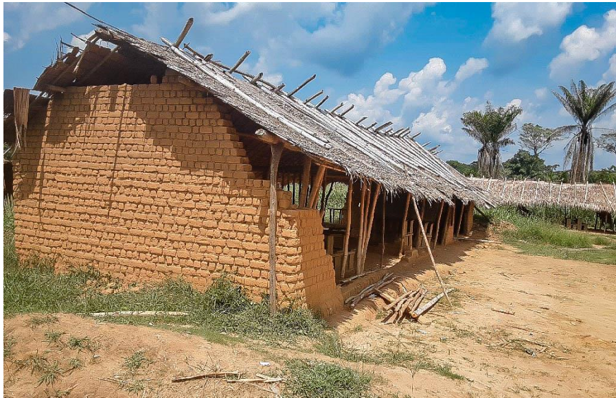
Ecole Primaire BOSO NGUBU Equateur/Basankusu