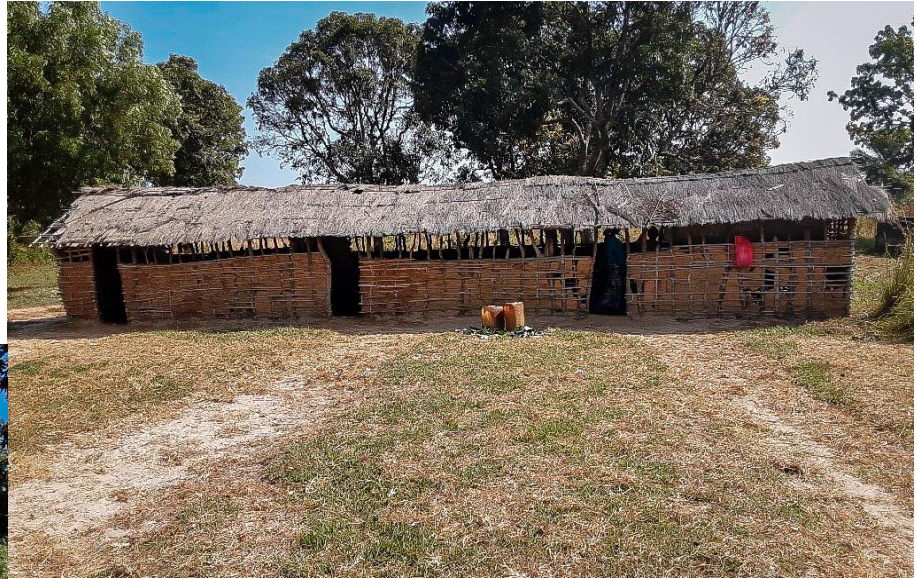
Ecole Primaire Lycée NZAMBA Kwango/Kahemba