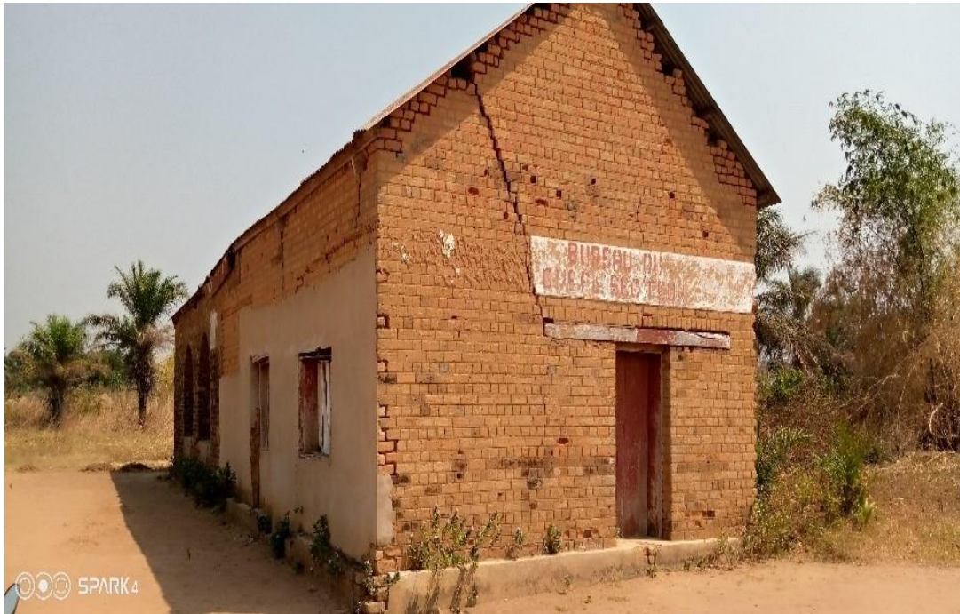
Bâtiment administratif Secteur de TSHIBOTE Kasai Central / Demba