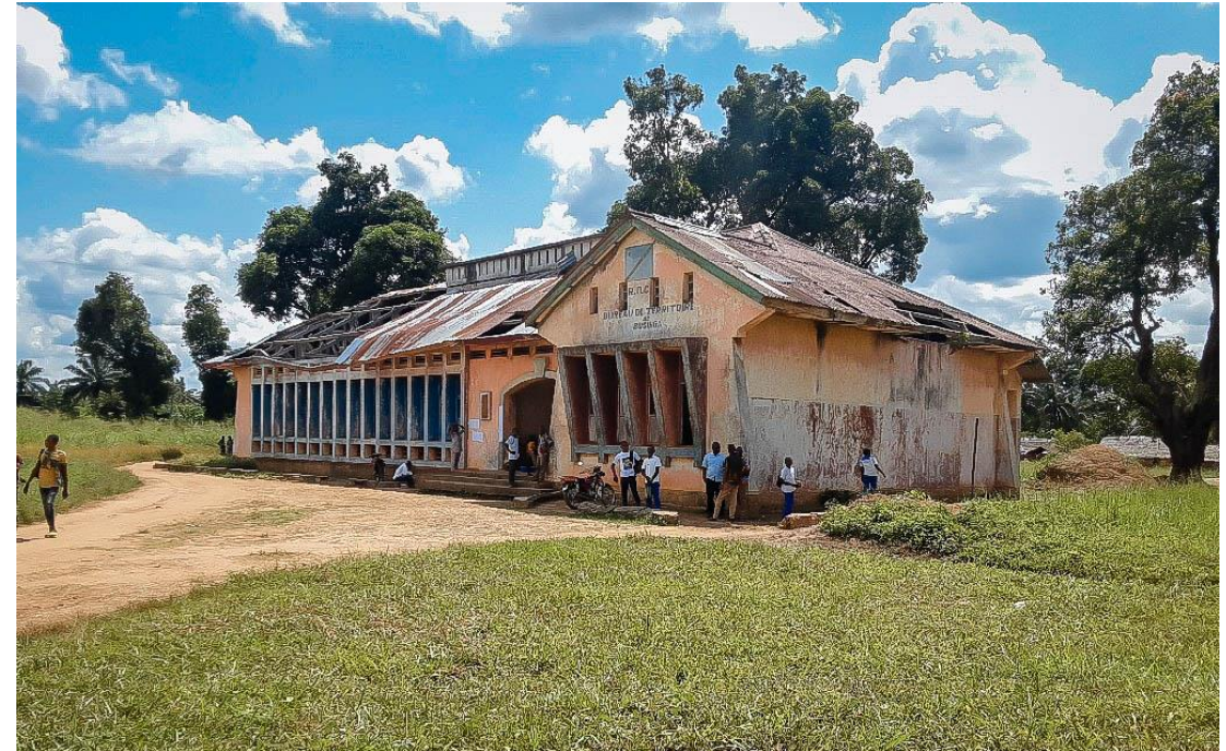
Bâtiment administratif Nord Ubangi / Businga