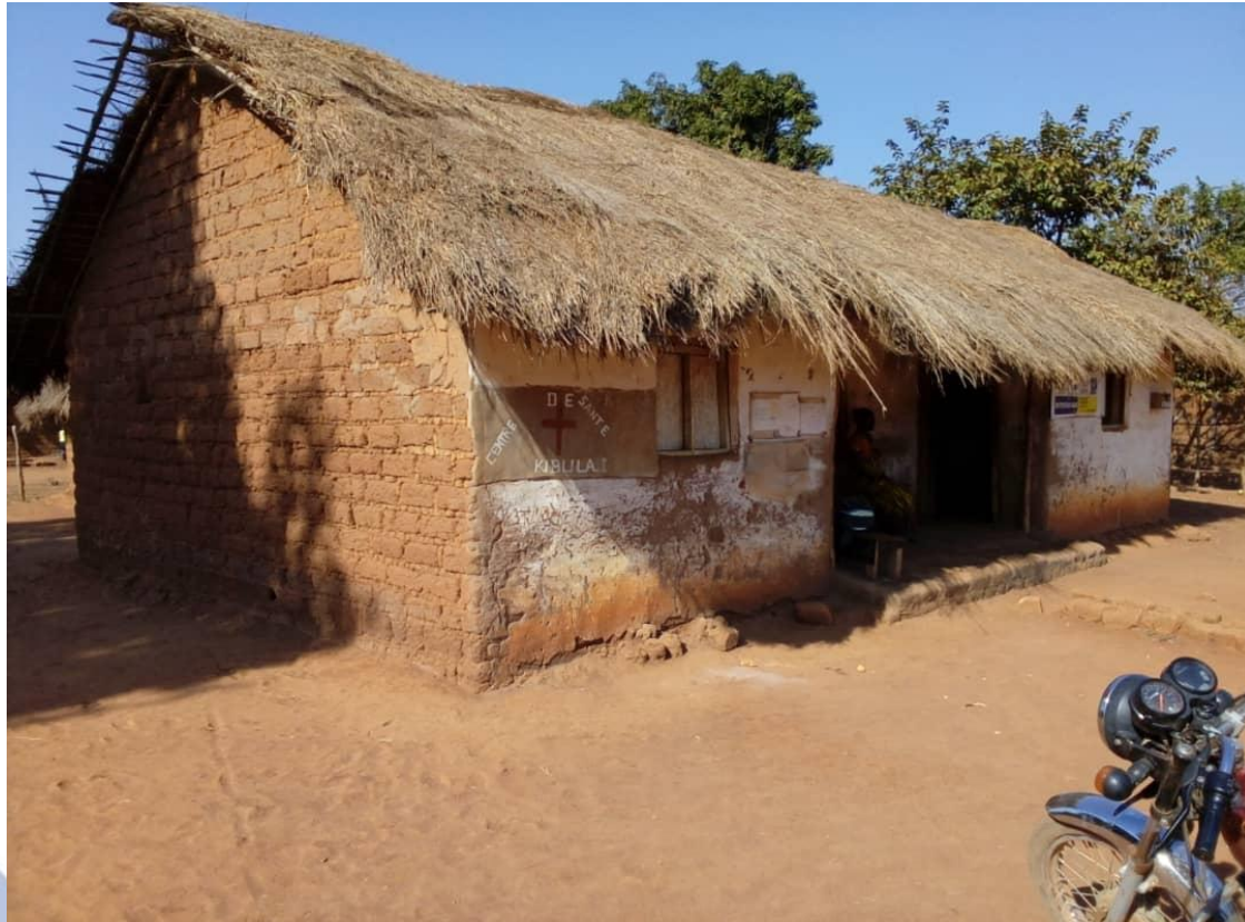
Centre de Santé KIBULA I Haut-Lomami