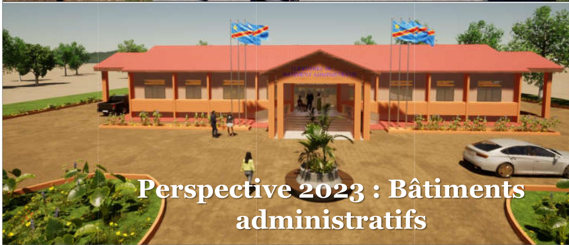
Perspective 2023 : Bâtiments administratifs