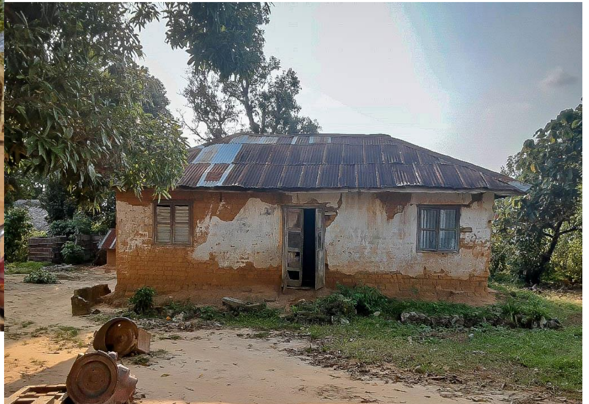
CENTRE DE SANTE SEMENDUA CITE MAI NDOMBE/KUTU