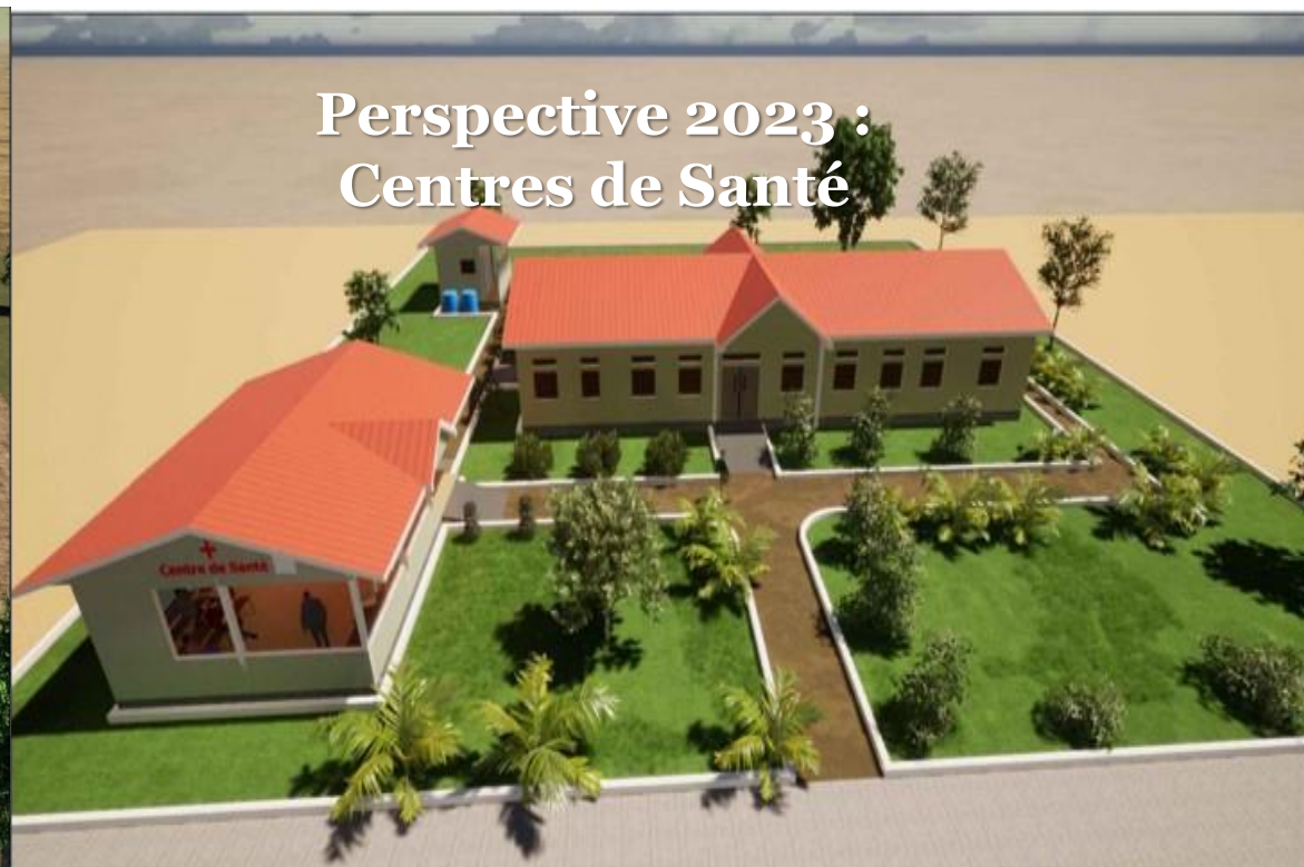
Perspective 2023 : Centres de Santé